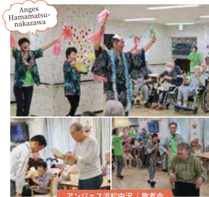
アンジェス浜松中沢 | 敬老会

アンジェスでは季節に合わせた行事やライブなどのイベントを毎月開催しております。 みなさまの笑顔あふれる様子をお届けします！