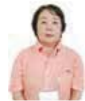
居宅介護支援事業所 ケアマネージャー

入居されるお客様が、アンジェス姫路でしっかりとした生活の基盤を築き上げ、心身ともに健やかな生活を送っていただけるよう、精一杯支援していきたいと思ひます。今後とも宜しくお願い致します。