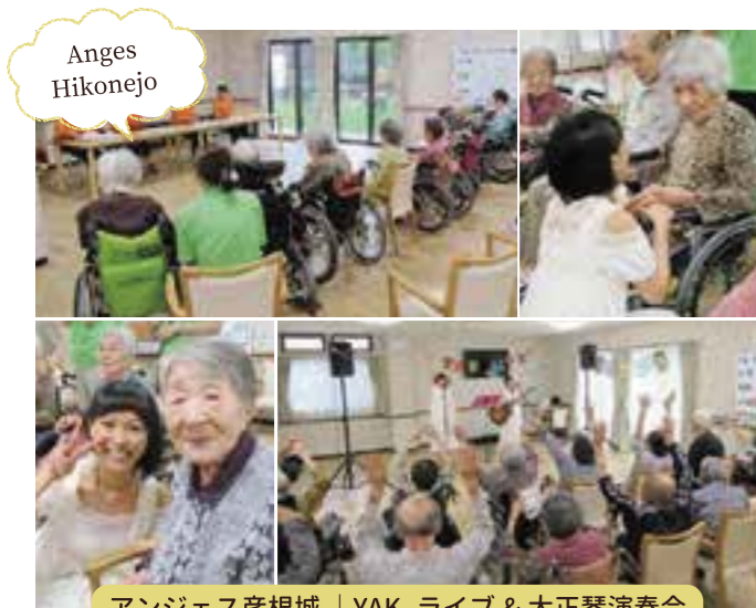
アンジェス彦根城 | YAK. ライブ & 大正琴演奏会

素敵な歌声とギターのリズムで入居者様もスタッフもとても癒されました。 言葉が心にしみ、最後にお一人お一人に話しかけられる姿がとても印象に残りました。 次回も来て下さる事を楽しみに日々を送りたいと思います。 YAK.さん、ありがとうございました。