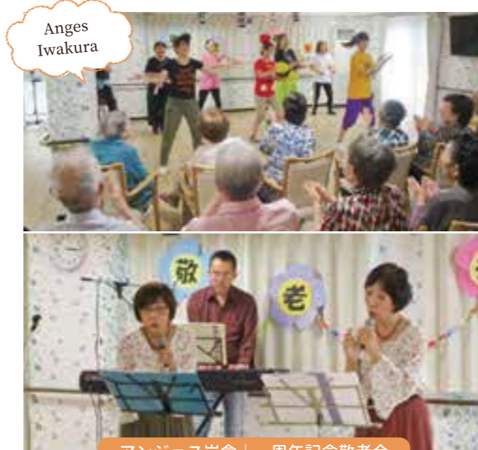
アンジェス岩倉 | 一周年記念敬老会

敬老祝賀会&仮装カラオケ大会を行いました。 入居者様も最初は恥ずかしそうにされて、なかなか歌って頂けませんでした。職員と一緒に唄うと笑顔で手拍子してください、職員が仮装して登場すると一層喜んで下さり、お茶とお菓子も皆さんで食べて頂きながら敬老のお祝いもさせて頂き楽しい時間をすごしました。