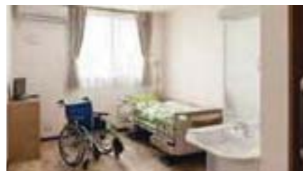
単身部屋(例) | 他に夫婦部屋もございます

「アンジェス姫路」はただいま入居を受け付けております。ご相談・見学・体験入居も承っておりますので、ぜひお気軽にお問い合わせ下さい！