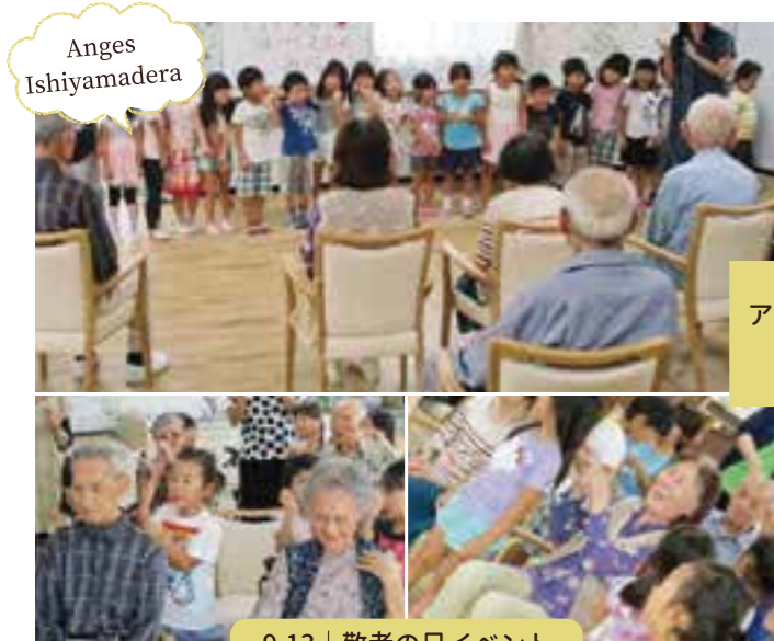
アンジェス 石山寺