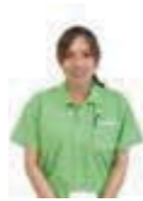
訪問介護事業所 サービス提供責任者

毎日たくさんの人との出会いをとて楽しんでしています。ご利用者様、ご家族様お一人お一人の気持ちに寄り添い、毎日笑顔と愛であふれた日々を送っていたるだけに、スタッフ一同、頑張ってまいりますので宜しくお願い致します。