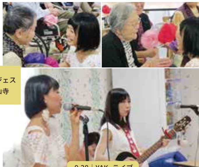
9.28 | YAK. ライブ

保育園の子供たちがアンジェス石山寺に遊びに来て下さいました。 歌と肩たたきのプレゼント、そして一緒に手遊びとじゃんけんゲームで入居者様も笑顔が溢れました。あまりにも子供たちが可愛くて涙するスタッフもいました(笑) 楽しい敬老の日のイベントになりました。