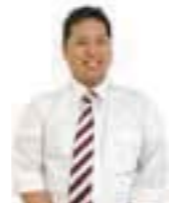
施設管理部 エリアマネージャー