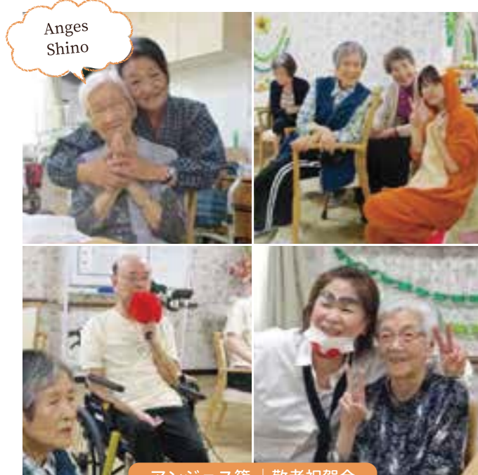
アンジェス篠 | 敬老祝賀会

敬老の日に皆さんで和菓子とお茶をを食べながらお話をしました!! 皆さんおいしいと言いながら食べていただきとても楽しい時間を過ごせました。 また、お月見という事で貼り絵をしてもらいました。 思い思いの色の折り紙を貼りながらとてもかわいい作品に出来上がりました。