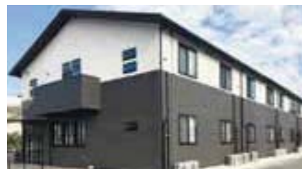
アンジェス姫路外観 | 趣のある和風の建物です

9月に「アンジェス姫路」にてオープン前内覧会を開催しました。猛暑、大型台風…とスタート前は不安でしたが、初日から予想外に大きな反響をいただき会期を急遽延長！たくさんの方にアンジェス姫路を知っていただくことができました。アンジェスシリーズは日本各地で展開しておりますが、兵庫県は初進出。より深くアンジェスを理解していただくために、見学会や体験入居などを開催していく予定です。今後も皆様とともに歩み成長するサービス付き高齢者向け住宅であるよう努力してまいります。