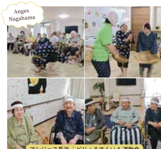
アンジェス長浜 | どじょうすくい & 運動会

YAK.さんのライブがあり、普段レクレーションに来ておられない方も参加して下さい、笑顔で手拍子されたり、歌をうたって楽しんでおられました(^-^) また、20日は大正琴の演奏があり、昔懐かしい曲を皆様と一緒に歌っておられました(*^u^*) アンジェス彦根城の入居者様は皆様歌が大好きなのでとても喜んでおられました☆