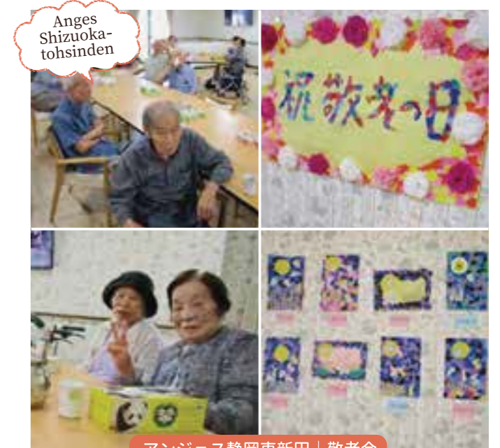
アンジェス静岡東新田 | 敬老会

銭太鼓の鑑賞会を前から楽しみにしておりました。 民謡と共に華やかな衣装で踊る姿に皆様喜ばれ、拍手で答えられました。 終了後にはアンコールをされ大変満足いただけたようです。 ぜひまた来て頂きたいとおっしゃられていました。