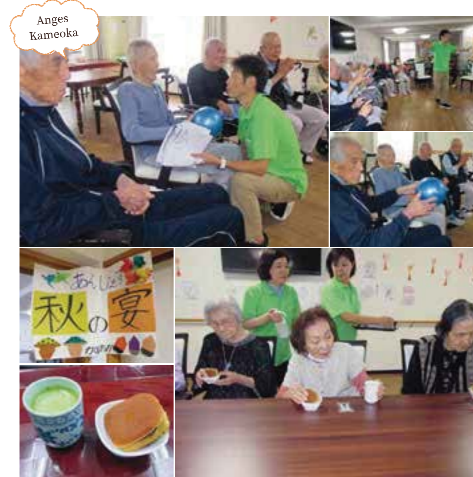
アンジェス亀岡 | 秋の宴

アンジェス岩倉の一周年記念を兼ねて、敬老会を開催しました。 ボランティアさんによる素敵な歌に皆さんうっとりされた後は、職員の出し物に大爆笑!! 大盛況に終わりました♪ これからも笑顔の絶えない、楽しいアンジェス岩倉を目指していきたいと思っています。