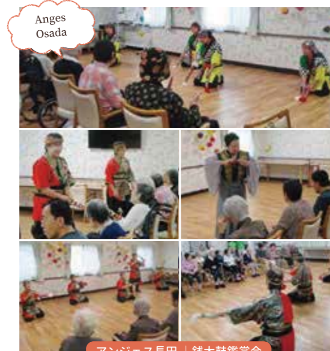
アンジェス長田 | 銭太鼓鑑賞会

9月と言えば敬老会。 浜松中沢では皆様に感謝状をお贈りさせていただきました。 その後は、なんと?!" マツケン"ならぬ"ハルケン"?? が美女を引き連れて登場！ 皆様、お腹がねじれてしまいそうに大笑い!! おひねりも飛び交いモ〜大変……。炭坑節を踊ったり歌を歌ったり楽しいひと時をお過ごし頂きました。