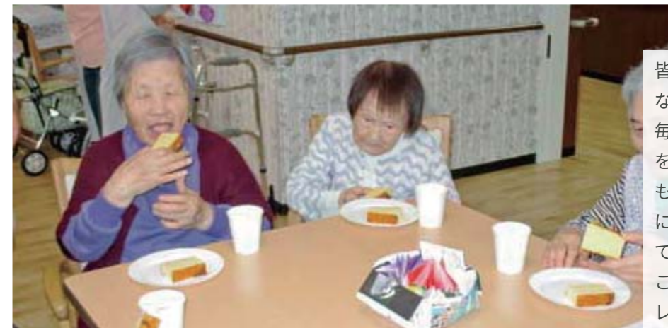
from. アンジェス 彦根城

皆さん暑さに負けず笑顔や笑い声が絶えない日々を過ごされています。毎日のレクリエーションでは色々なゲームをし、月 1 回その月のお誕生日のお祝いもしています♪今月はプレゼントと一緒にカステラやお抹茶でお祝いをして、とても喜んでおられました。これからも皆さんが楽しめるようなレクリエーションを考えて行きたいと思えます。