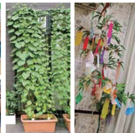
from. アンジェス 浜松中沢