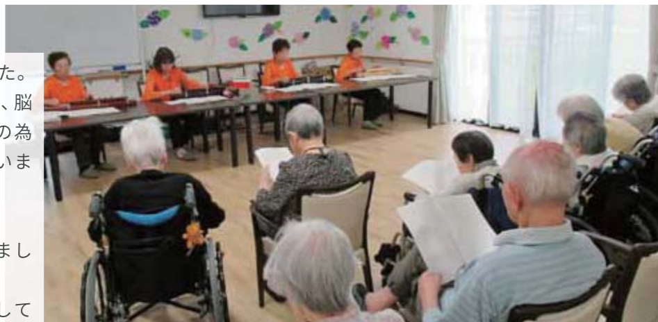
from. アンジェス 彦根

夏が近くなり、暑い日も多くなりました。アンジェス彦根では、みんなで楽しく、脳の活性化、機能改善を考慮しみんなの為になるレクリエーションを展開しています。20日は、大正琴演奏会です。美しい音色に合わせて、みんなで歌いました。これからも、より楽しい時間を過ごしていただけるよう、頑張っています。