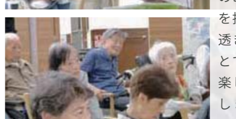
from. アンジェス 篠