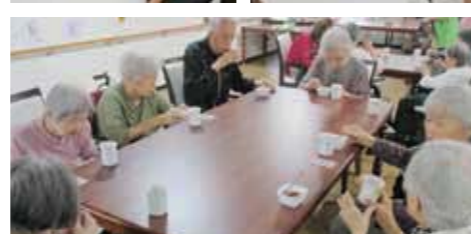
from. アンジェス 亀岡