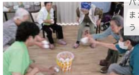
from アンジェス 中庄