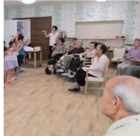
from アンジェス 石山寺