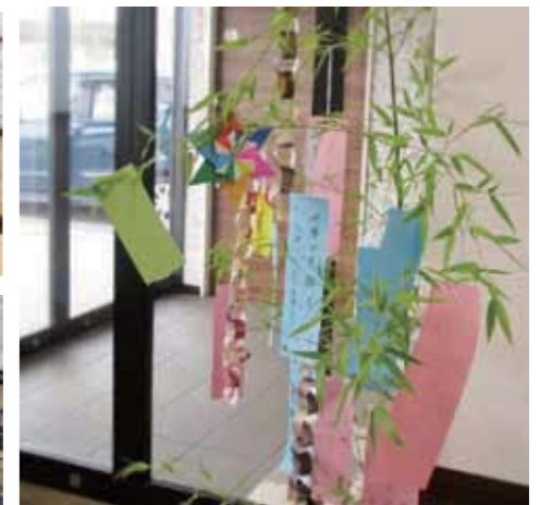
from. アンジェス 長浜