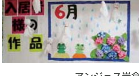
from. アンジェス 岩倉