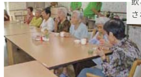
from アンジェス 当新田