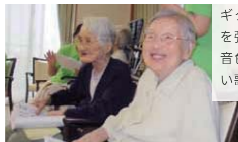
from. アンジェス 堅田