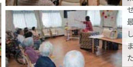
from. アンジェス 長田