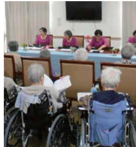
from. アンジェス おごと