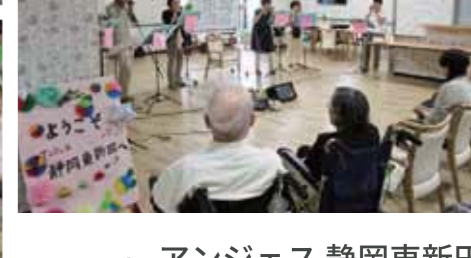
from. アンジェス 静岡東新田